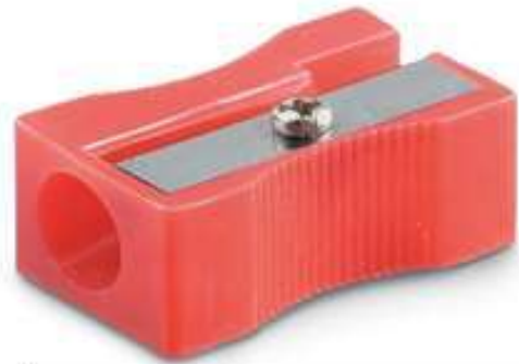
Sacapuntas de plástico