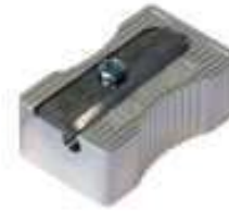
Sacapuntas de acero